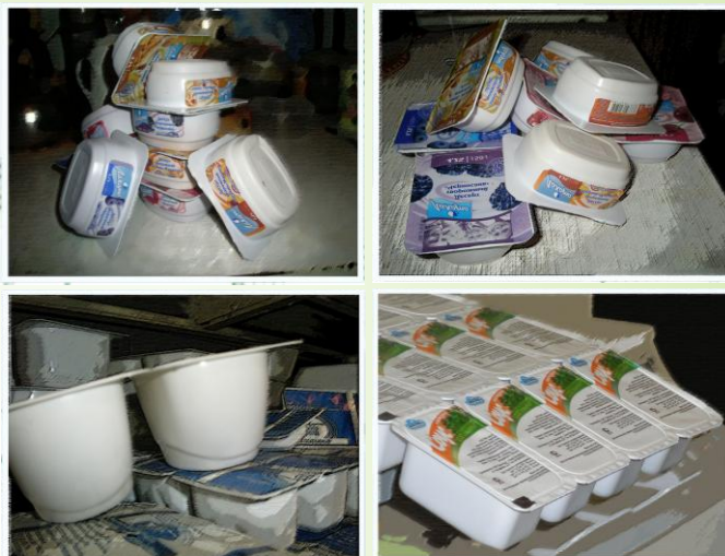
3D дизайны стаканчиков

Мы предлагаем дизайн стаканчиков любой конфигурации